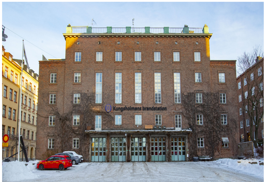
Bilden visar Kungsholmens Brandstation som uppfördes på 1930-talet.

Kungsholmens Brandstation, Kartagos Backe 3, ligger längs med Hantverkargatan, mittemot Kungsholmens gymnasium på Kungsholmen. Fastighetskontoret förvärvade fastigheten 2009. En omfattande upprustning och renovering av Kungsholmens brandstation, med syftet att verksamhetsanpassa lokalerna åt Storstockholms Brandförsvär, är i slutskedet.